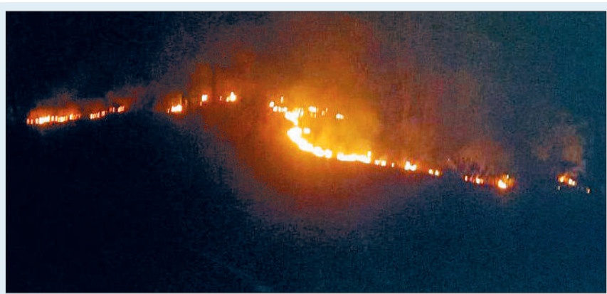
भीषण आगजनी पर शीघ्र नियंत्रण की मांग

कुकदुर तहसील के पंडरिया वन परिक्षेत्र अंतर्गत पहाड़ी सारपानी के खुराआमा -पटिया क्षेत्र के जंगलों में पिछले कई दिनों से भीषण आग लगी हुई है, जिससे न केवल न, पौधों का नाश हो रहा है, बल्कि पुराने और बड़े पेड़-पौधे भी जलकर राख हो रहे हैं। इस भीषण आगजनी की चपेट में आने से इलाके की जैव विविधता पर भी भारी असर पड़ा है। दुर्लभ वन्य जीव-जंतु और औषधीय पौधों की प्रजातियां इस आपदा में प्रभावित हो रही हैं। स्थानीय ग्रामीणों से मिली जानकारी के अनुसार वन विभाग के अधिकारी, विशेष रूप से बोट गार्ड मौके पर न तो आग बुझाने पहुंचे हैं और न ही स्थिति का जायजा लेने। बताया जा रहा है कि बोट गार्ड का मुख्यालय करीब 15 से 28 किलोमीटर दूर कुकदुर में है, जबकि वे सरईपानी-सेंदूरखार में निवास हेतु भवन बनाया हुआ है। ऐसे में उनकी क्षेत्र पर पकड़ कमजोर नजर आ रही है। इस गंभीर घोर लापरवाही का आलम यह है कि पुरे वन क्षेत्र की सुरक्षा एक-दो स्थानीय चौकीदारों के भरोसे छोड़ दी गई है, जो आगजनी पर नियंत्रण पाने में असफल साबित हो रहे हैं। वहीं अब तक कई हेक्टेयर जंगल जलकर नष्ट हो चुका है और आग फैलती ही जा रही है।