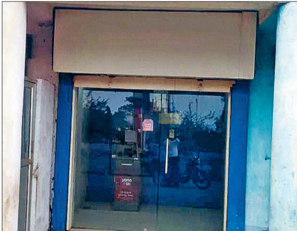
ताकि क्षेत्र के जरूरतमंद ग्रामीणों को राहत मिल सके।

जिला मुख्यालय अंतर्गत ग्राम जोराताल स्थित एटीएम मशीन महिनो से बंद होने से ग्रामीण एटीएम कार्डधारियों को भारी दिक्कतों व परेशानियों का सामना करना पड़ रहा है। वहीं ग्रामीण इधर उधर भटकने मजबूर है। जिस पर ग्रामीणों ने जिम्मेदारों को इस ओर ध्यान देने तथा एटीएम मशीन बंद को जल्द से जल्द चालू करने की मांग की गई।