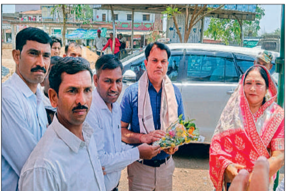
वन अधिकार पट्टा वितरण

ग्राम पंचायत मुद्दीपार में गुरुवार को अटल डिजिटल सुविधा केंद्र का शुभारंभ हुआ। अब पंचायत के लोगों को जल्दी सुविधाएं उपलब्ध होंगी। इस केंद्र के शुरू होने से ग्रामीणों को विभिन्न कार्य के लिए अब ब्लॉक एवं जिला मुख्यालय नहीं जाना पड़ेगा। यहां नागरिक सुविधाओं से संबंधित सेवाएं, वित्तीय सेवाएं, सीएससी की सेवाएं ऑनलाइन होंगी। अटल डिजिटल सेवा केंद्र के माध्यम से लोग जन्म-मृत्यु प्रमाण पत्र, आय, निवास जाति प्रमाण पत्र, विवाह पंजीयन, राजस्व सेवा के लिए आवेदन कर सकेंगे। यहां नगद आहरण, राशि ट्रांसफर, बीमा, कृषि, पेंशन, पैन कार्ड संबंधित काम भी होंगे। सीएससी सेवा के तहत विभिन्न सरकारी योजनाओं का पंजीयन भी होगा। बिजली बिल भुगतान, रेल टिकट बुकिंग आदि भी गांव से हो सकेगा।